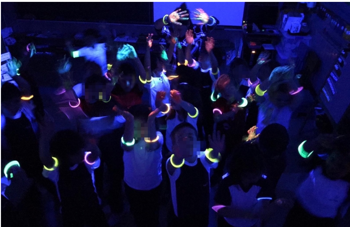
Imagen 7. Toda la clase de 5 años creando su danza.

Al terminar, llevamos a cabo otra danza libre por el espacio de la clase mientras suena River flows in you de Yiruma . (Anexo 6)