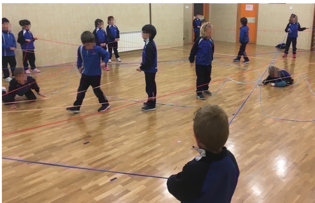
Imagen 3. Alumnos de 5 años siendo conscientes del baile de sus compañeros.

Finalmente, comentamos en asamblea qué momento nos ha gustado más, si el estar bailando o estar observando, con cuál hemos aprendido, qué pasos y movimientos hemos hecho y qué cosas nos han parecido fáciles o difíciles y si cambiaríamos algo. (Anexo 2)