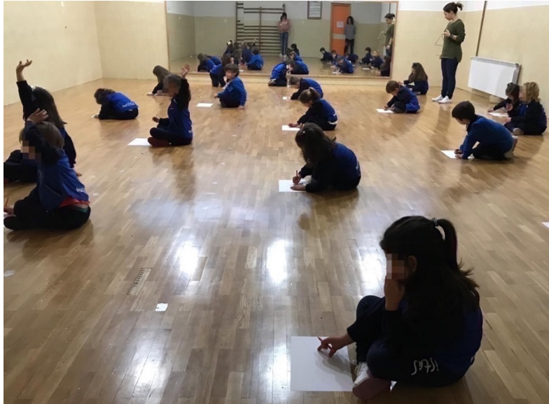
Imagen 5. Niños de 5 años siguiendo el sonido.

Al terminar, de nuevo, comentamos en asamblea qué habían aprendido, qué parte les había resultado más fácil o más difícil, en qué momento de la luz se habían concentrado y centrado más en la actividad y si hubiesen usado otro material que les fuese más cómodo para dibujar. (Anexo 4)