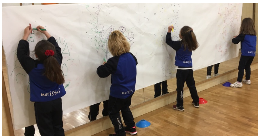
Imagen 6. Alumnas de 5 años desarrollando el entrenamiento naranja.

Al terminar, hablamos en asamblea sobre los dos roles que tenía la actividad, cómo nos ha resultado pintar y usar los dos rotuladores, si la música ha sido la adecuada o hubiésemos preferido una más lenta, entre otras cosas. (Anexo 5)