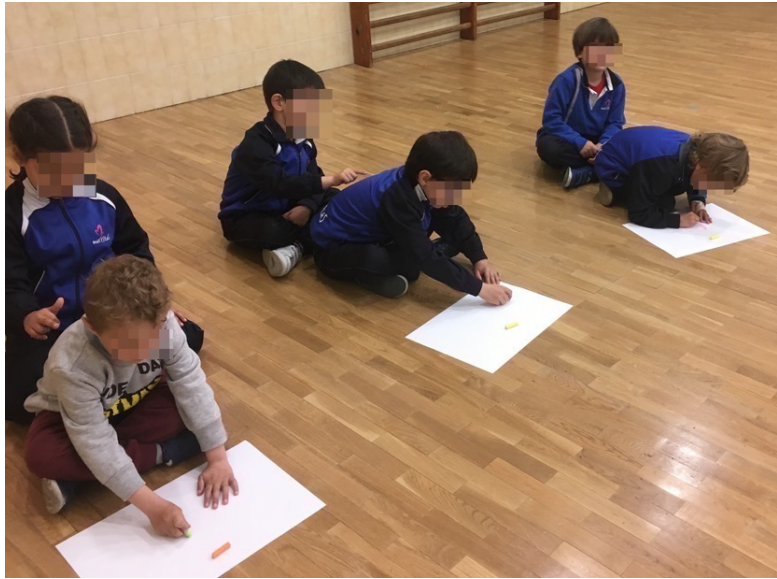
Imagen 4. Niños haciendo el entrenamiento rojo.