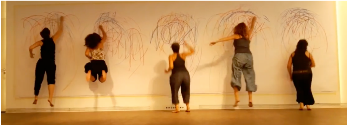
Imagen 1. Adultos realizando el entrenamiento naranja en una formación impartida por Segni Mossi.