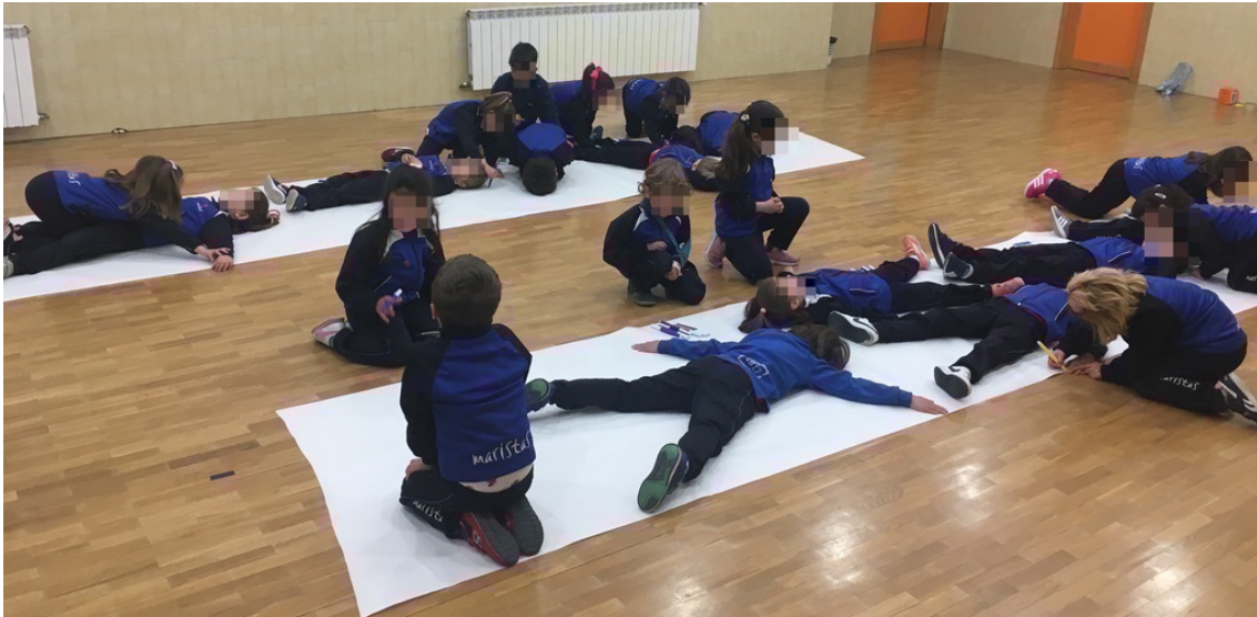
Imagen 2. Alumnos de 5 años dejando su signo gráfico.