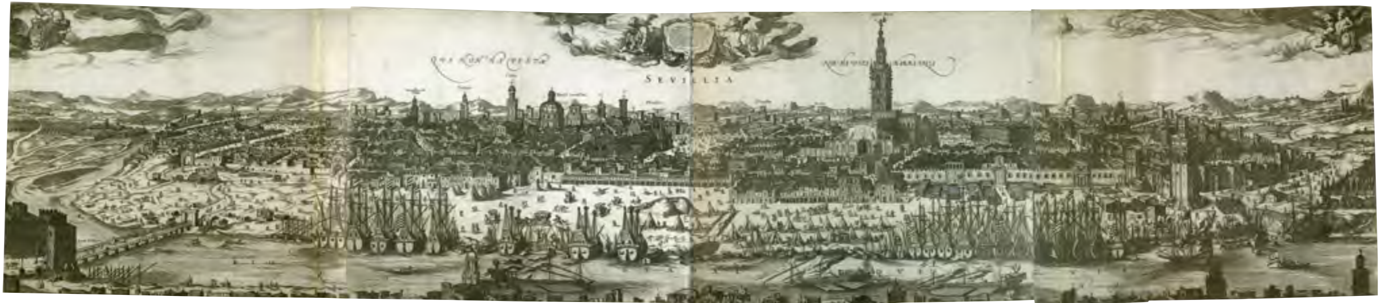
“QUI NON HA VISTA SEVILLIA NON HA VISTA MARRAVILLA”. Grabado anónimo editado por Johannes Janssonius. La Haya, 1617.

presentan acompañados por obras artísticas –pinturas, esculturas, grabados, piezas textiles, etc.– de los siglos XVI y XVII u objetos cotidianos de la época –instrumentos mercantiles, muebles, monedas, tarros de farmacia, etc.– que, además de realzar los manuscritos, ayudan a comprender mejor su contenido. En su mayor parte, estas obras históricas pertenecen a los fondos gestionados por la Fundación Museo de las Ferias –especialmente los pertenecientes al legado de Simón Ruiz–, habiéndose unido a ellas otras piezas procedentes de importantes instituciones como el Archivo de la Real Chancillería de Valladolid, el Museo de Valladolid, la Diputación Provincial y varias iglesias y monasterios de la Archidiócesis vallisoletana.