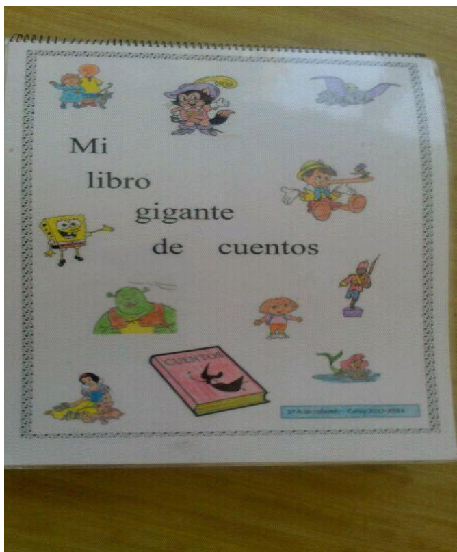
Un ejemplo de Portada a seguir.