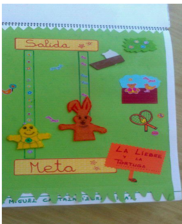
Otra de las opciones.