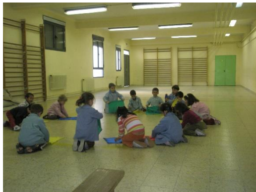
Figura 2. Gimnasio.