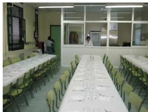
Figura 1 . Aula de música/comedor.