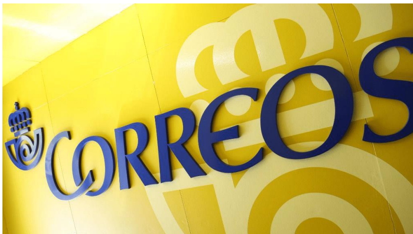
Imagen 4.