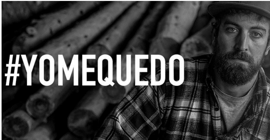
Imagen 3.

Para analizar en primer lugar la situación de la mensajería en el Mundo Rural, habría que hacer un gran énfasis en la definición de la España Vacuada que se trata de una realidad que está creciendo cada año más y en donde provincias con un número de habitantes muy reducido ven como sigue decreciendo constantemente, incluso llegando a existir cada vez más pueblos casi deshabitados. Este fenómeno está teniendo una gran incidencia en el mercado de las comunicaciones y la mensajería que es en lo que estamos focalizando este trabajo.