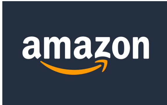
Imagen 8.

Amazon cuenta con un total de 29 Almacenes distribuidos en Italia, España, Reino Unido, Alemania, Republica Checa, Francia y Polonia, donde este último nombrado cuenta con un total de 100.000 metros. Para poder entender cómo funciona esta actividad logística, debemos entender que cada centro se conecta con una enorme red de conexiones entre unos almacenes y otros. De esta manera cuando un cliente desea adquirir un producto en Francia, Amazon tiene un sistema de detención por el cual puede ver en todos y cada uno de sus almacenes, cual es el más cercano para poderse recibir en el momento que se realiza el “click” tan pronto como posible. De hecho podemos afirmar que casi un 25% de los productos que están en el centro de Madrid se envían a otros lugares fuera del país.