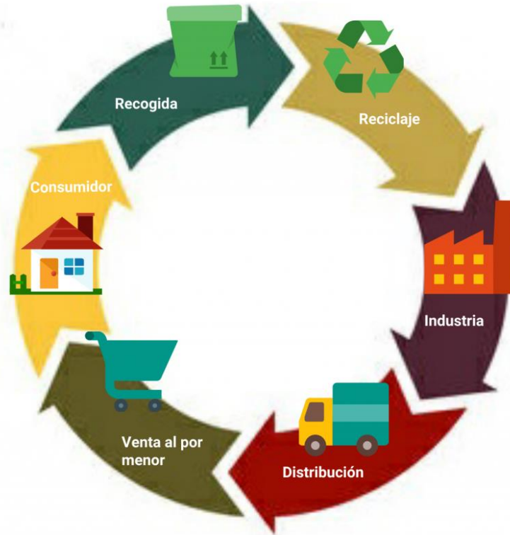
Imagen 2.

La sociedad de hoy en día toma conciencia del gran uso de residuos y envases que se producen para recibir un pedido que llega a nuestros domicilios.