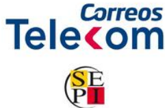
Imagen 7.

La Empresa aporta a su cartera de clientes las máximas garantías de seguridad en cuanto a fiabilidad, trazabilidad e integración total con sistemas tecnológicos.