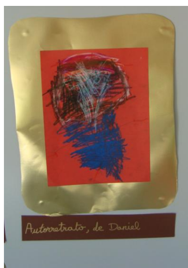
Fig.9 Autorretrato, de Daniel. 2 o Nivel de E.I.