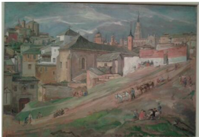
Fig 4. August Bresgen “El Convento de San Pablo”