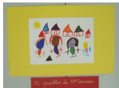
Fig. 17. Mi pueblo, de Maricarmen.