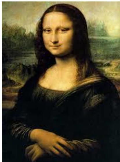
Fig. 2 Leonardo Da Vinci, “La Gioconda” (1503)