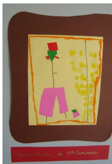
Fig.6 Maricarmen “La agricultora” 2 o Nivel de E.I