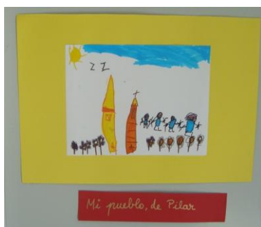
Fig. 18. Mi pueblo, de Pilar.