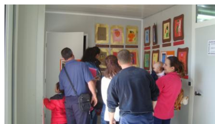
Fig. 20 Día antes de la inauguración.