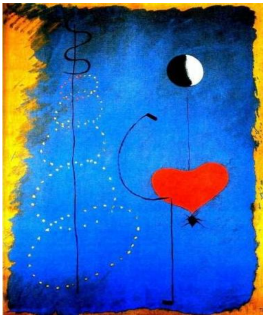
Fig. 1 Joan Miró, “La bailarina” (1925)