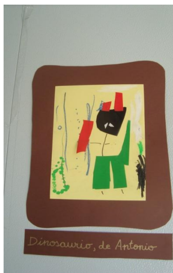
Fig.5 Antonio, “El Dinosaurio”. 1 er Nivel de E.I