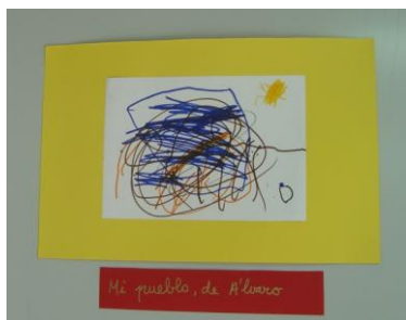
Fig. 14. Mi pueblo, de Álvaro.