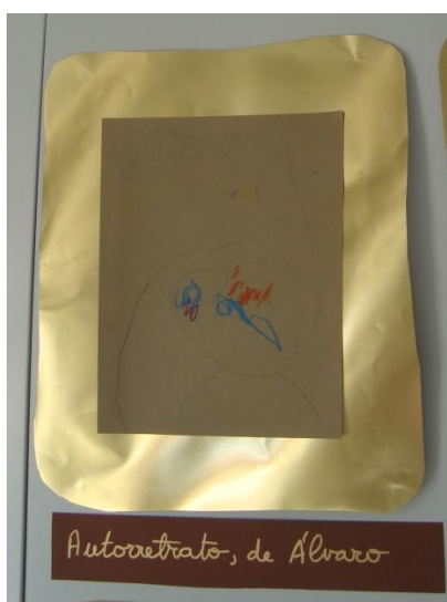
Fig.8 Autorretrato, de Álvaro. 1 er Nivel de E.I