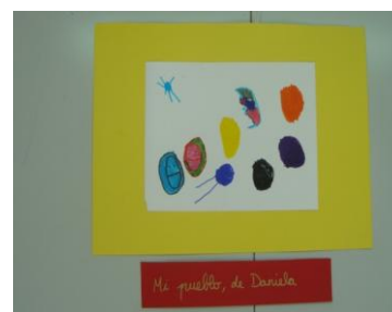
Fig. 15. Mi pueblo, de Daniela.