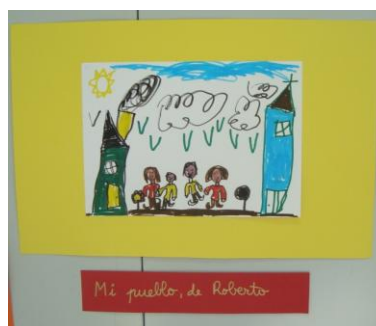
Fig. 19. Mi pueblo, de Roberto.