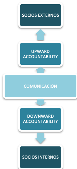
GRÁFICO 1. COMUNICACIÓN ASCENDENTE Y DESCENDENTE.

ANEXO II: Gráficos 1 y 2 (elaboración propia). Comunicación ascendente, descendente y holística. Upward, downward and Holistic accountability.