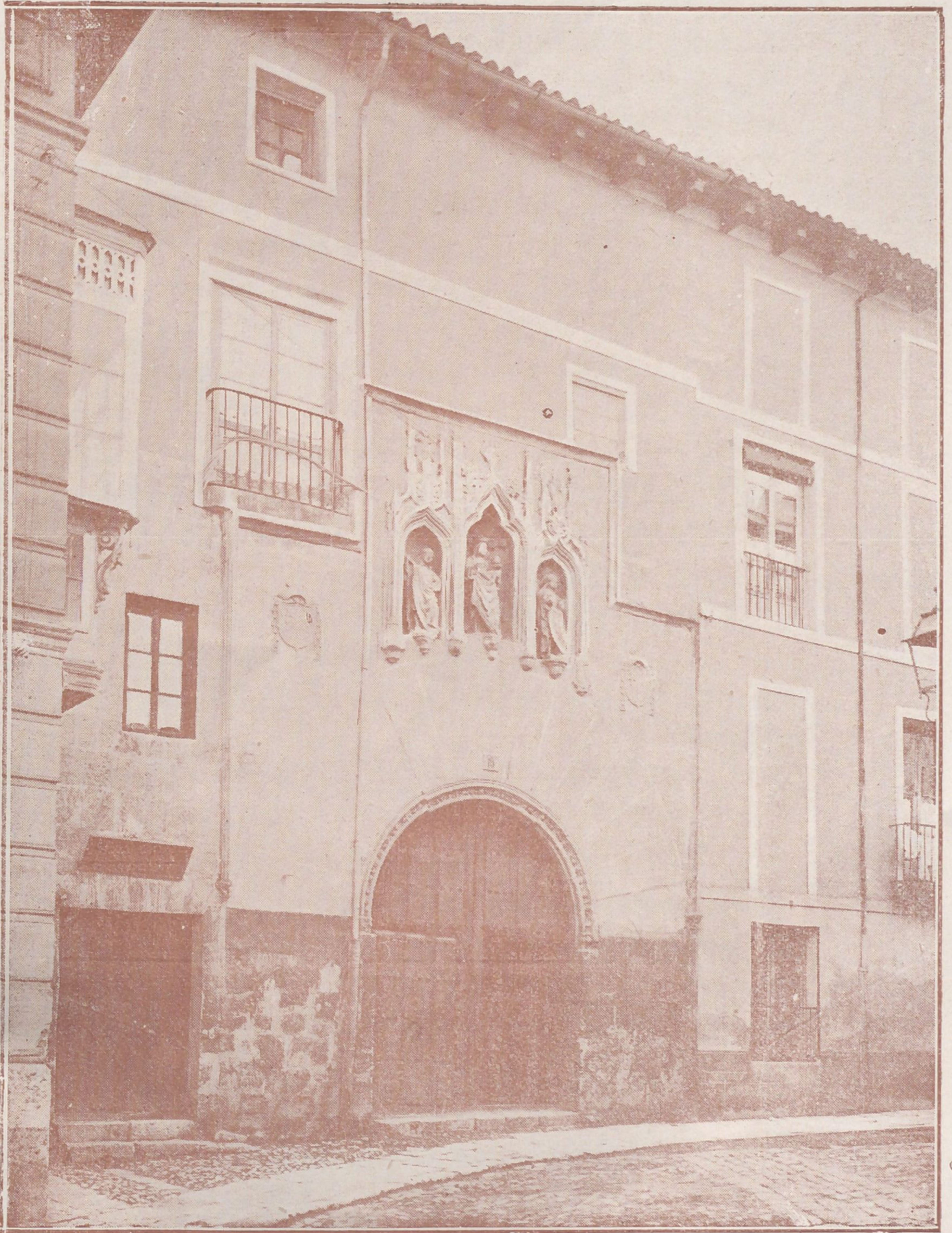
PUERTA DE ENTRADA AL PATIO DE EL ROSARILLO