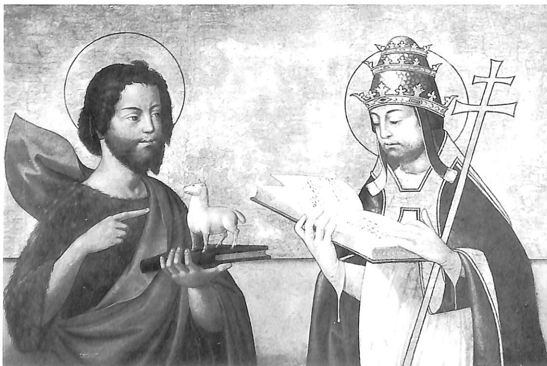
1. Dormición de la Virgen, atribuible a Cristóbal Llorens.—2. San Juan Bautista y San Gregorio, atribuible a Pedro de Cisneros.