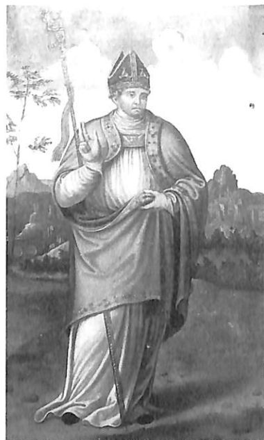
1. Misa de San Gregorio, por Antonio Vázquez.—2. Anunciación con donante, por Antonio Vázquez.—3, 4 y 5. San Sebastián, San Roque y San Clemente, en restauración.