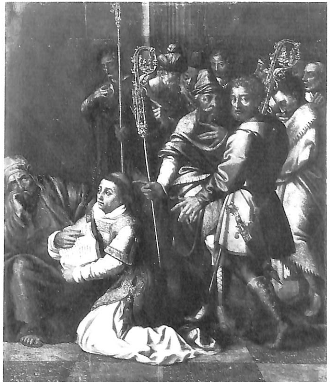
1 y 2. San Francisco y Calvario, en periodo de restauración.—3. Cristo resucitado, atribuible a Bartolomé de Castro.—4. San Esteban adoctrinando en el Templo, atribuible a Martín Gómez el Viejo.