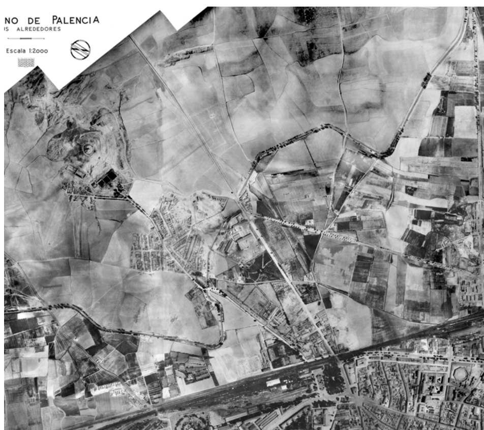
Foto 4. El Sector Noreste de la ciudad