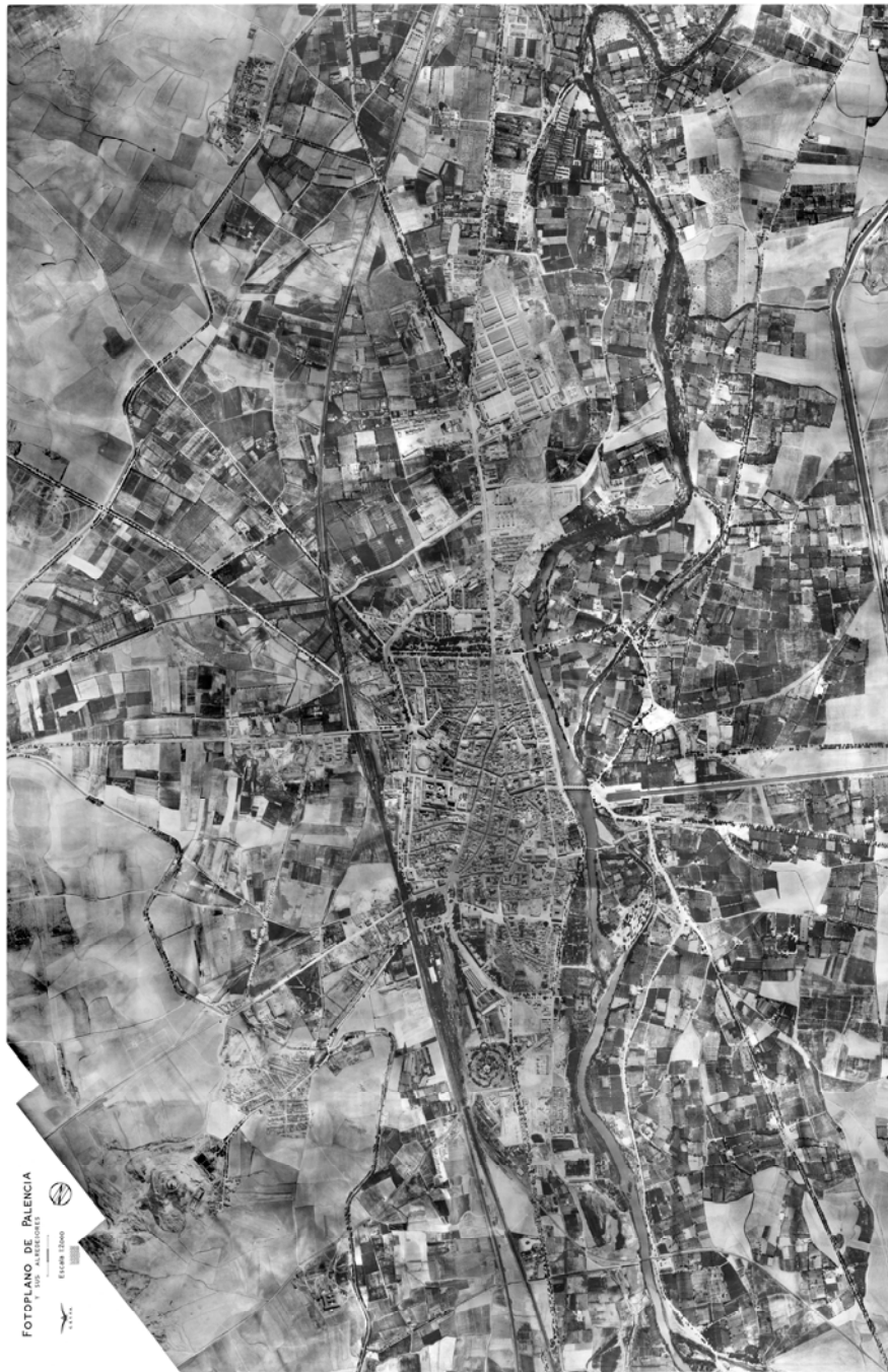
Foto 2. Fotografía aérea de Palencia en 1949, tal como se expone en el Archivo Histórico Provincial de Palencia. Fotocomposición de Inmaculada San José Negro