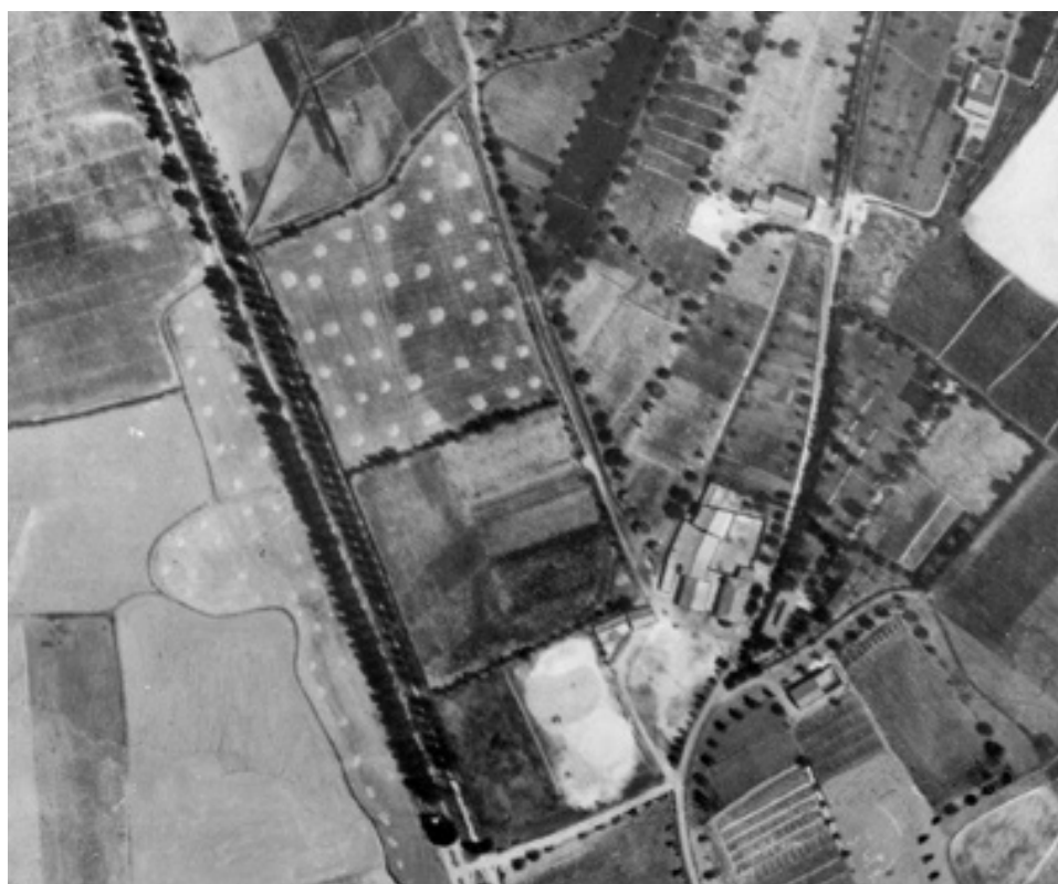
Foto 1. Parcela de secano con haces de mies junto al arroyo de Villalobón

La foto parece estar realizada a finales de julio o principios de agosto, deducción que se apoya tanto en el vigor del follaje del arbolado, como en la intensidad del color de las huertas, y también en los haces de mies que se observan distribuidos regularmente en numerosas parcelas de secano en forma de puntos blancuecinos sobre las tierras, una vez segadas.