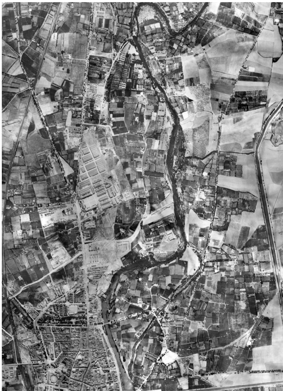
Foto 8. El sector suroeste de la ciudad