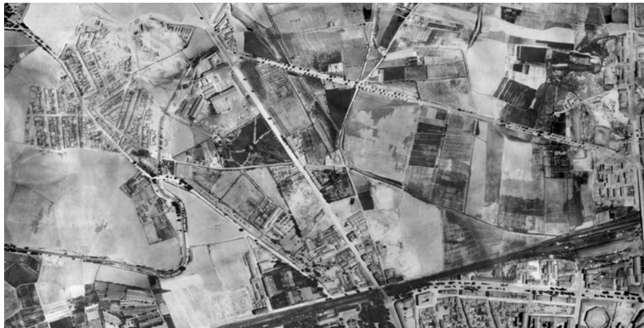
Foto 5. El Cristo, Ave María y Eras del Bosque

2.2.5. Más abajo del Canal de Palencia, en el espacio existente hasta la avenida de Victorio Macho, se observa el solar de lo que fue la fábrica de relojes de torre y de campanas, conocida por la Campanera en el que se están levantado los edificios de las Casas de la RENFE y, más hacia el norte, las obras de explanación de los terrenos en los que inmediatamente se empezarán a levantar las Casas de Francisco Abella. Del barrio del Ave María solo hay construcciones en la calle Anastasia Santamaría, en la esquina de lo que fue la fábrica se ven la casa de la Campanera 4 , construida en 1923, y algunas otras edificaciones en la misma calle. Las casillas molineras, levantadas poco tiempo después, en las llamadas calles de los partidos judiciales (Astudillo, Saldaña, Carrión, Cervera, Baltanás y Frechilla), allí donde acabó construyéndose el cine Otero, ni siquiera se halla iniciada su construcción.