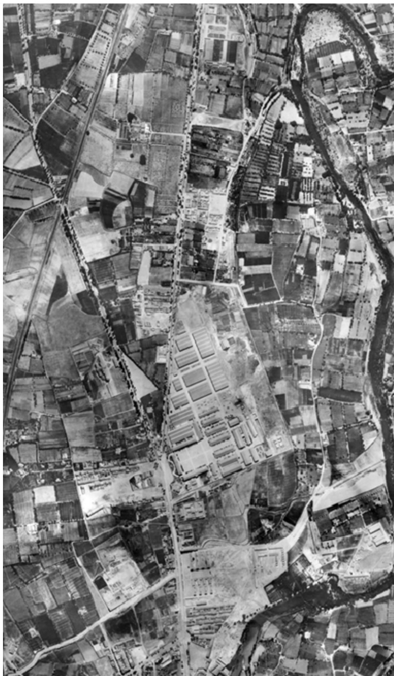
Foto 9. Los barrios del Carmen, Campo de la Juventud y Segundo y Tercer barrios