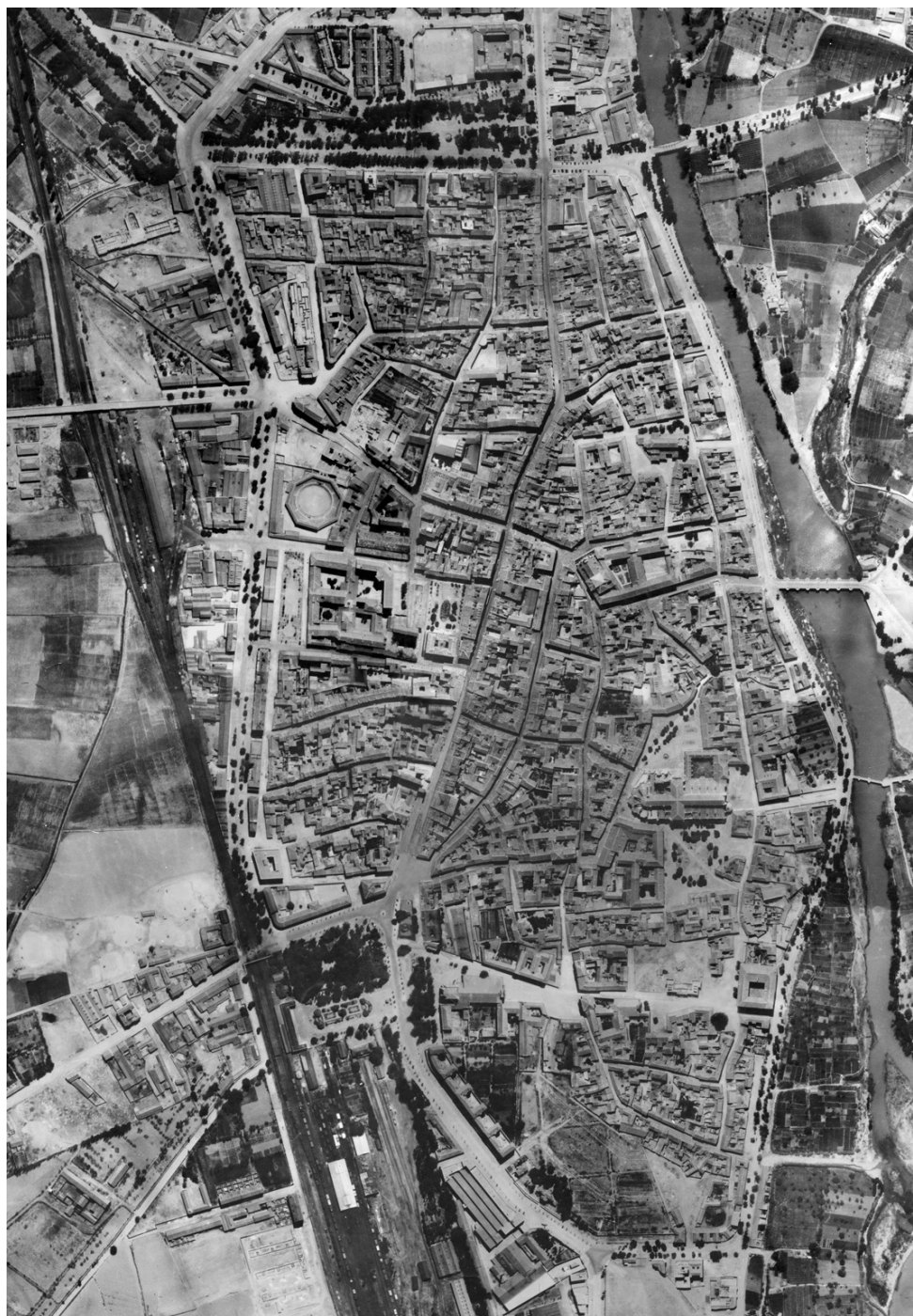
Foto 3. El Casco Histórico