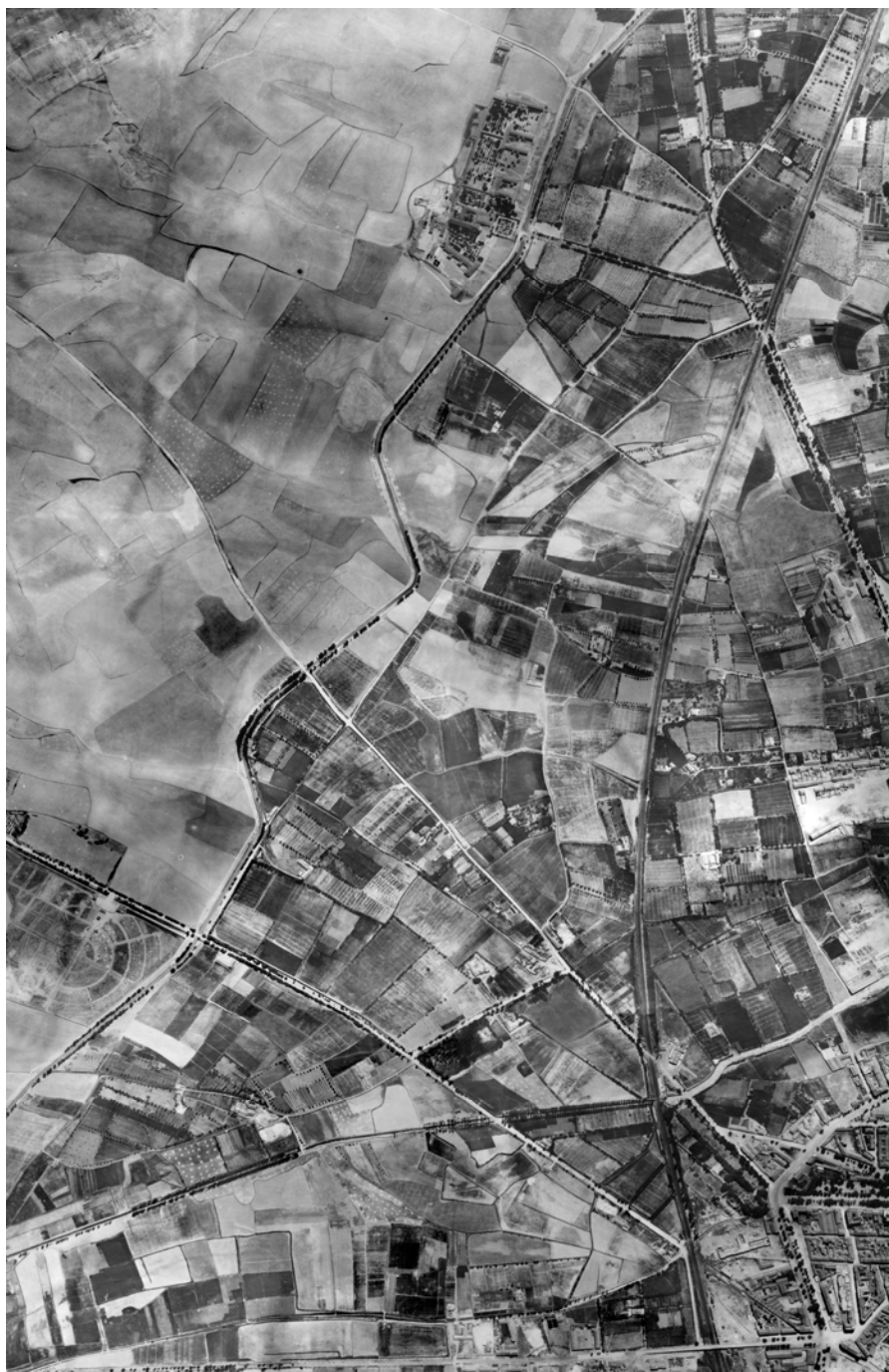
Foto 6. El sector sureste de la ciudad