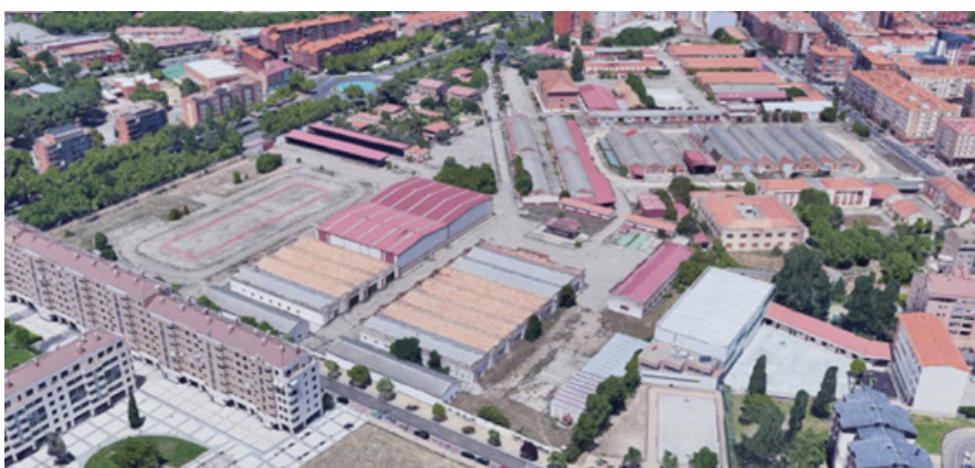
FIG. 7/ Estado actual del acuartelamiento de La Rubia

Este planeamiento, inicialmente rechazado por parte del Ministerio de Defensa en mayo de 2019 (COMUNIDAD DE CASTILLA Y LEÓN, 2020, p. 18684), fue finalmente aceptado en junio de 2020 (COMUNIDAD DE CASTILLA Y LEÓN, 2021, p. 15953) y, a su vez, prevé 8 años como plazo para establecer la ordenación detallada, es decir 2028 (Figs. 7 y 8).