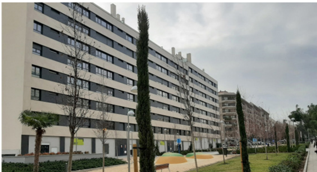
Fig. 4/ Obras de nueva construcción en el solar del Taller de Precisión de Artillería (TPA)