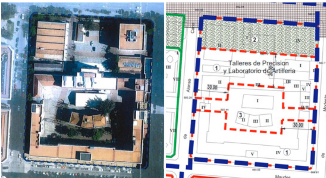
FIG. 3/ Delimitación del Área de Planeamiento Remitido (APR) 07.09 TPA Raimundo Fernández Villaverde sobre ortofoto y propuesta

Tampoco atendió a las argumentaciones que señalaban que las condiciones de la zona verde pública y el patio de manzana revelaban la