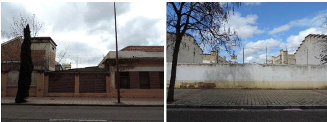
FIG. 5/ Muros exteriores del acuartelamiento de la Rubia

En Valladolid, ya en 2007 se especuló sobre el cierre del acuartelamiento para efectuarse en 2011 y la construcción de entre 500 y 700 viviendas, de las cuales un 30% debería corresponderse a vivienda social (ÁLVAREZ, 2007; ÁLVAREZ & ALRRÚE, 2011). Sin embargo, la infrutilización del área duró hasta diciembre de 2014, cuando fue oficialmente abandonada por