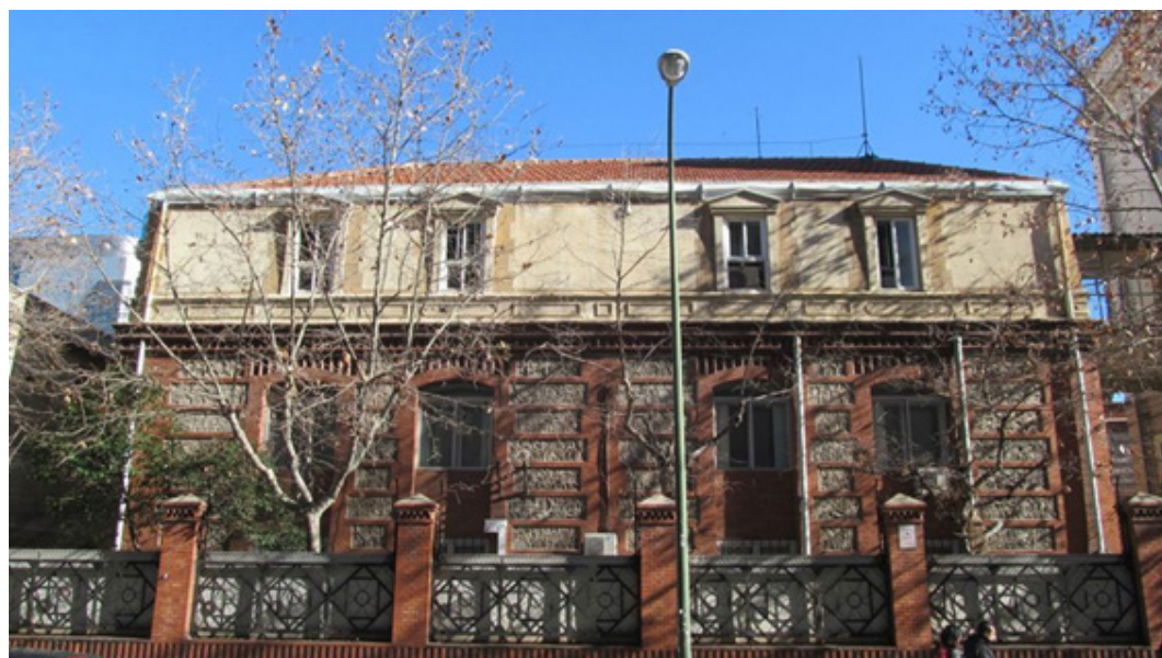
FIG. 2/ Taller de Precisión de Artillería

En marzo de 2014 el Ministerio de Defensa declaró la desafectación al fin público, la alienabilidad y puesta a disposición del INVIED del TPA. Ese mismo mes se efectuó la preceptiva comunicación previa a la enajenación a la Subdirección General de Patrimonio del Estado, que fue respondida en abril indicando que “el inmueble no se considera de interés para otros servicios de la Administración General del Estado”. Concluido este trámite, en agosto de 2014 se autoriza al INVIED, por acuerdo del Consejo de Ministros, para enajenar en subasta pública el TPA con un precio tipo de licitación de 90 278 264,98 €, con