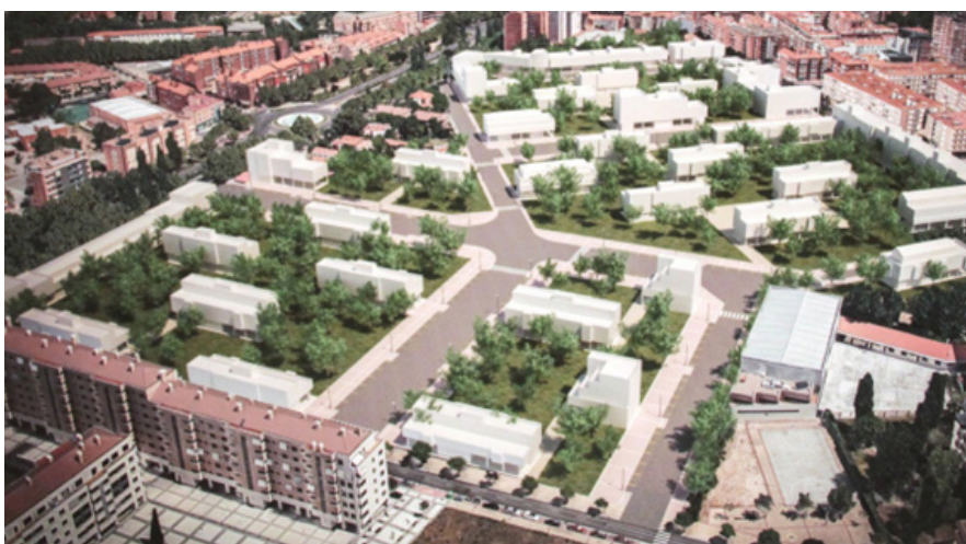
FIG. 8/ Render de la nueva configuración del Acuartelamiento de la Rubia en la Revisión Plan General de Ordenación Urbana de Valladolid