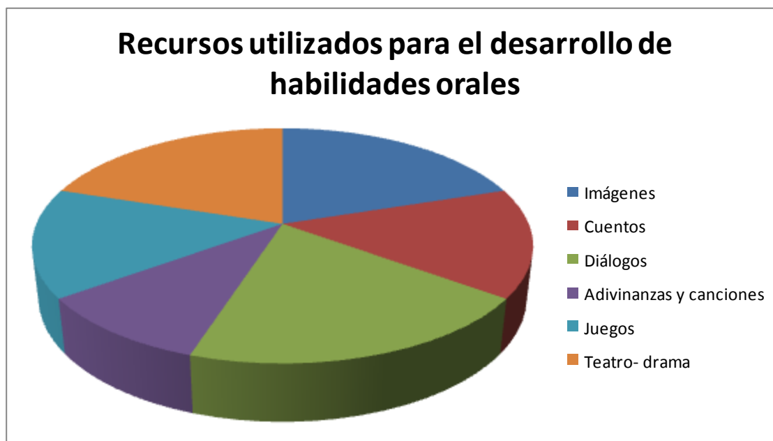
GRÁFICO 3: Explicación visual de los recursos comunes utilizados por el profesorado para el desarrollo de las habilidades orales en el alumnado.

educativos eficaces y utilizados en el desarrollo de habilidades orales con un 15% cada uno de ellos. Y finalmente con un 10% de valoración está el uso de las adivinanzas y canciones en el aula.