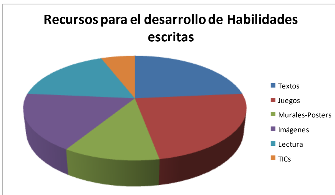
GRÁFICO 4: Explicación visual de los recursos comunes utilizados por el profesorado para el desarrollo de las habilidades escritas en el alumnado.

tics dentro del aula cuenta con un 6%. Resultado paradójico con la importancia que el alumnado da a las nuevas tecnologías.