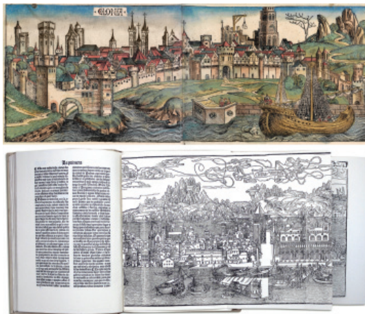
Fig. 5 - Above: M. Wolgemuth and W. Pleydenwurff, view of Cologne, Nuremberg Chronicle (1493), hand coloured xylograph. Below: B. Breidenbach, view of Venice, Peregrinatio in terram sanctam (1498); xylograph.

year 1493. One of these first depictions, the view of Cologne showing the profile of the city from the opposite bank of the river, maintains a very realistic line of sight, simulating the view of a spectator over the land. In this time period printed images were more of a distraction and fidelity was not much demanded. In the case of the Chronicle , the artwork was made with elements that were reused several times throughout the book. Also significant is the view of Venice of 1498 from Bernhard von Breidenbach, which comes from the incunabulum Peregrinatio in terram sanctam , which contains a magnificent fold-out of the city's facade from the canal next to St. Mark's Basilica, defined by an elevated horizon line from which we can observe illusory hills; the image transmits two antagonistic worlds: objective reality below this line and subjective fantasy above it (Fig. 5).