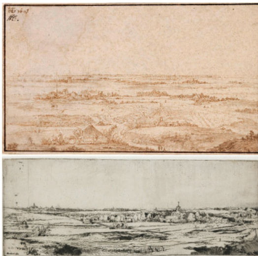
Fig. 13 - Upper: Hendrick Goltzius, Dunes near Haarlem (1603); quill (9 x 15 cm); Museum Boijmans Van Beuningen, Rotterdam. Lower: Rembrandt H. van Rijn, Landscape With a View Toward Haarlem (1651); etching (12 x 21.9 cm); British Museum, London.

slight elevation it offers a broad view of approximately 180 degrees of the area around Haarlem, with vigorous strokes and some of the first vacant foreground, wherein the elements of the landscape are reduced to abstract forms, though perfectly identifiable by the landmarks. Both visions share a horizon in the middle of the drawings (Fig. 13)