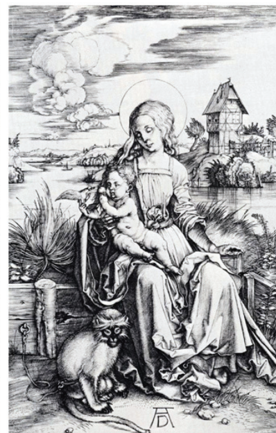
Fig. 6 - Albrecht Dürer. Above: Countryside Near Kalkreuth Village (ca. 1495); watercolour (10 x 31 cm); Kupferstichkabinett, Berlin. Lower Left: House by a Pond (ca. 1496); watercolour (21 x 23 cm); British Museum, London. Lower Right: The Virgin and Child with the Monkey (1498); chalcographic engraving (19 x 12.3 cm); Albertina, Vienna.

images to document these new lands. The concept of a new world necessitated new ways of recording the things found there with a greater level of abstraction, like with maps, that permitted a wide-ranging perceptual framework of a particular terrain by means of a codified representation of greater extensions –orthogonally projected– which was very inspiring for the pioneers of landscape painting; for this reason the first sentence of Ptolemy’s Geography defines geography as a “portrait of the world”. These portrayals would be complemented with topographical views, with a reduced field of vision and greater perceptual realism –with a conical perspective– that were more related to the surveying of small areas.