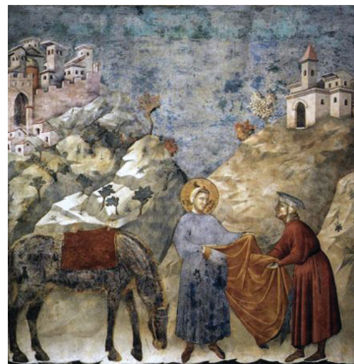
Fig. 2 - Left: Giotto, St Francis Giving his Mantle to a Poor Man (ca 1296); fresco (270 x 230 cm); Basilica of Saint Francis of Assisi. Right: Konrad Witz, The Miraculous Draught of Fishes (1444); tempera on panel (13.2 x 15.4 cm); Geneva Musée d'Art et d'Histoire.