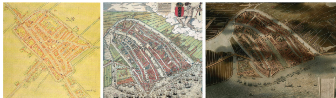
Fig. 16 -Left: Jacob van Deventer, map of Delft (1556). Centre: Cornelis Anthonisz, topographic aerial view of Amsterdam (1544); xylograph, brush and water-colour (109 x 107 cm); Rijksmuseum, Amsterdam. Right: Jan Christaensz Micker, Bird's Eye View of Amsterdam (ca. 1652); oil painting on canvas (137 x 100 cm); Amsterdam Museum.

Dutch artists added visual experience to the perspective, aggregating the partial views permitted by the circular movement of the eyes, as our sight upon observing a flat panoramic expanse, more by illusion than perception, is a convex field, like that represented by Koninck in his paintings (Fig. 15). This cartographic-artistic imbrication culminates with Jan C. Micker painting his Bird's Eye View of Amsterdam (1652) on the frontier between a plan and a painting, as can be appreciated when it is compared with the map of Delft (1556) from the plattengronden of Jacob van Deventer, combining the graphic nature of the first with the realistic qualities of the second. The city appears so perpendicular that it cancels out the horizon line. In a similar fashion, Micker needed to make use of the vistas of Cornelis Anthonisz from the 16th century, those that took away the horizon –certainly with the coloured xylograph or the engraving from 1544–, approximating to an even greater extent the composition of a coloured map. The transition from the cartographic medium to the pictorial one was common practise. Painters were frequently