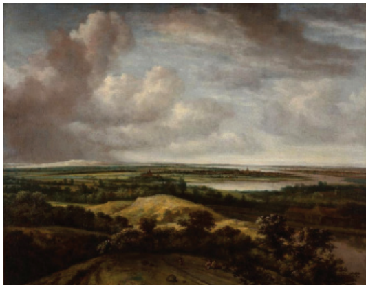
Fig. 15 -Philip Koninck, Landscape with a river and sanddune (1664); oil painting (121 x 95 cm); Museum Boijmans Van Beuningen, Rotterdam.

Dutch artists added visual experience to the perspective, aggregating the partial views permitted by the circular movement of the eyes, as our sight upon observing a flat panoramic expanse, more by illusion than perception, is a convex field, like that represented by Koninck in his paintings (Fig. 15). This cartographic-artistic imbrication culminates with Jan C. Micker painting his Bird's Eye View of Amsterdam (1652) on the frontier between a plan and a painting, as can be appreciated when it is compared with the map of Delft (1556) from the plattengronden of Jacob van Deventer, combining the graphic nature of the first with the realistic qualities of the second. The city appears so perpendicular that it cancels out the horizon line. In a similar fashion, Micker needed to make use of the vistas of Cornelis Anthonisz from the 16th century, those that took away the horizon –certainly with the coloured xylograph or the engraving from 1544–, approximating to an even greater extent the composition of a coloured map. The transition from the cartographic medium to the pictorial one was common practise. Painters were frequently