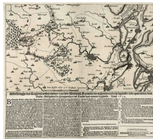
Fig. 12 - Upper: Claes J. Visscher, The Siege of Breda (1624); engraving; Rijksmuseum, Amsterdam. Lower: Diego Velazquez, The Surrender of Breda (1634); oil painting (367 x 307 cm); Prado Museum, Madrid.

In a similar way, half a century later, Rembrandt would execute a considerable number of sketches of the area around Amsterdam. One of these, his Landscape With a View Toward Haarlem (1651) is an example of the Dutch topographical style. It was the widest panorama in his oeuvre . From a