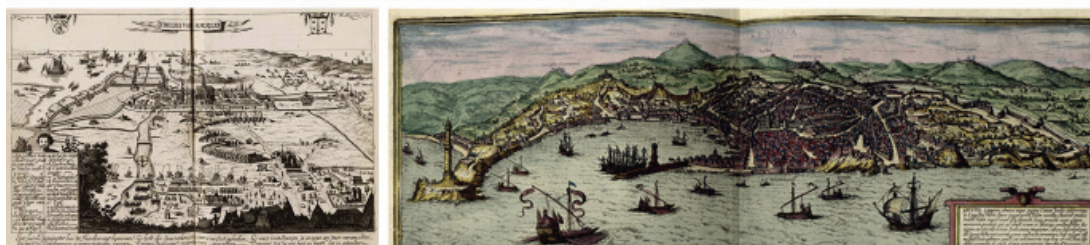
Fig. 10 - Claes Janszoon Visscher. Upper: View of London (1616), engraved; Library of Congress, Washington. Lower: View of Paris (1618); engraved (85 x 55 cm); Brigham Young University Library, in Provo, Utah.

from the north of Wyngaerde (1563) (Fig. 11). Even Velazquez, in The Surrender of Breda (1634), depicted the landscape background of the scene in the Dutch manner, utilising a high horizon line – at more than six tenths of the height of the painting – with the intention of being able to recognise the site of Breda perfectly, being undoubtedly inspired by the engravings of the time, like those of Visscher in 1624, wherein the location is recognisable and even the alignment of the army is depicted (Fig. 12).