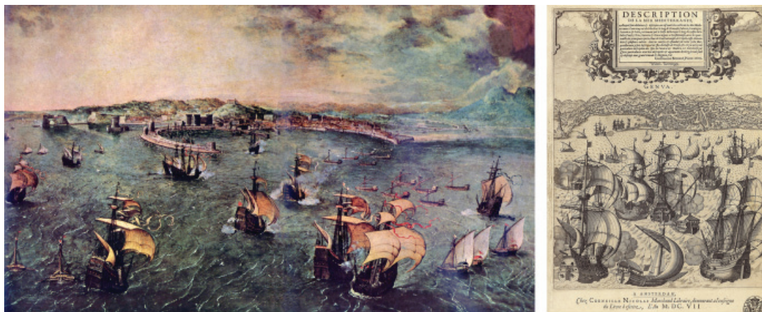
Fig. 9 - Upper Left: Pieter Bruegel, Naval Battle in the Bay of Naples (1558); oil painting on panel (39.8 x 69.5 cm); Doria Pamphij Gallery, Rome. Upper Right: Willem Blaeuw, Frontispiece of his book concerning nautical charts (1659); recorded in an atlas page (42 x 32 cm); Yale University Library. Lower Left: Anonymous Pieter Jansz. Saenredam, The Siege of Haarlem (1628); etching; in Samuel Ampzing, Beschreijvinge ende Lof der Stad Haerlem (Haarlem, 1628). Lower Right: Georg Braun and Franz Hogenberg, view of Genoa (1572), engraved in copper; in Joris Hoefnagel, Civitates Orbis Terrarum (ed. 1593).