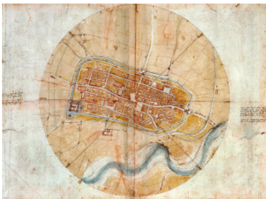
Fig. 3 - Leonardo da Vinci, Plan of Imola (ca 1502); quill, ink and watercolour (60 x 44 cm); Windsor Castle, Royal Library (RL 12284r).