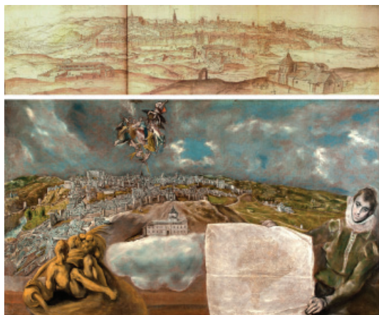
Fig. 11 - Upper: Anton van den Wyngaerde, view of Toledo (1563); quill, sepia ink and watery colour (107 x 42 cm); National Bibliothek, Vienna. Lower: El Greco, View and Plan of Toledo (1618); oil painting (228 x 132 cm); El Greco Museum, Toledo.

more terrestrial views of landscapes. As Alpers affirms: "The elevated horizons of maps were not kept, they were lowered, first to provide more space for the sky, and later for its clouds and other details" (1987, p. 209). They were views that were more abstract than those of maps, more attractive and easier to understand. During this transition the view of the landscape initially opted for an intermediate position, maintaining the horizon in the middle of the picture, with the observer situated at a slight elevation, like a "witness to an event" (Maderuelo 2008, p. 71), where neither the land nor the sky dominate and it is difficult to decide where our attention should be focused.