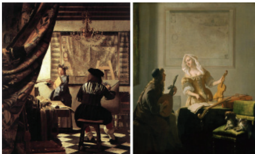
Fig. 7 - Left: Johannes Vermeer, The Art of Painting (1666); oil painting on canvas (120 x 100 cm); Kunsthistorisches Museum, Vienna. Right: Jacob Ochtervelt, The Music Lesson (1671); oil painting on canvas (80.2 x 65.5 cm); Art Institute of Chicago.