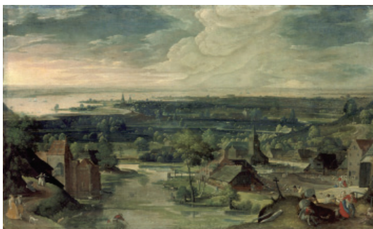
Fig. 14 - Hans Bol, River Landscape (1578), oil painting and tempera (74.5 x 46.5 cm); Los Angeles County Museum of Art.

Philips Koninck was one who stayed true to the cartographic format for a longer time, highlighting that was the enormity of his works. In them he introduced a soft curvature on the horizon, as can be seen in his Landscape with river and sanddune (1664) –similarly to the view of Toledo from El Greco–, perhaps as a result of the influence of his geographical knowledge. Fromentin associated this “circular vision” with the properties of a camera obscura, saying that the artist “sees the immense curved arch over the land or the sea as the real, compact and stable ceiling of his pictures” (1965, p.251). Panofsky affirmed that in reality “we perceive straight lines as curved ones” (2003, p.105); analogous could be our perception of the curvature of the trail of a plane crossing the sky. The