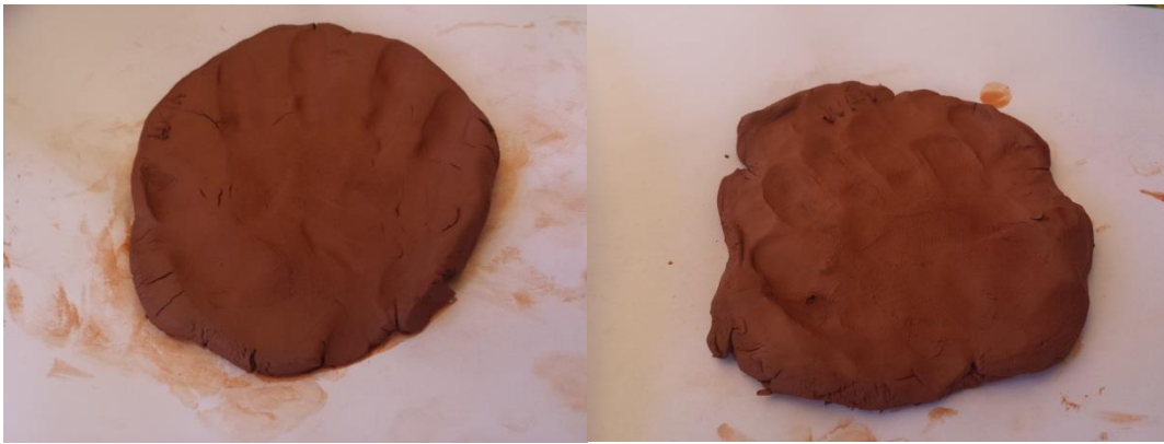
Figuras 1 y 2: Impresión de manos sobre arcilla

Planteamos para ello un ejercicio de experimentación con la materia y las imágenes, un ejercicio de realización y consolidación de las experiencias gráficas anteriores. Un ejercicio de impresión de manos sobre diferentes consistencias, barro, pasta de modelado de empleo de las manos en la realización de imágenes.