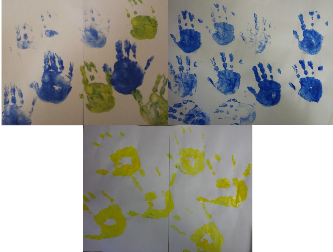
Dibujos 6, 7 Y 8: Impresión de manos; pinturas al agua sobre papel DIN-A3 (realizado por niños de 4, 5 y 7 años)

La facilidad del resultado descubre al niño rápidamente y de una manera natural el concepto de representación gráfica y refuerza sobre todo el de “imagen”, cómo entidad con autonomía propia, desligada del elemento real de procedencia