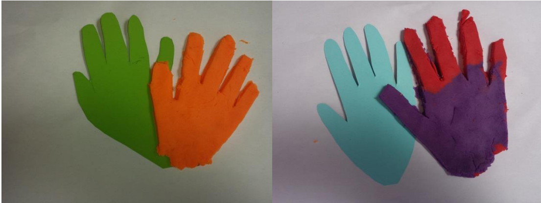
Figuras 4 y 5: Recorte de manos sobre plastilina

A partir de aquí se orienta al niño a la conclusión: la imagen es la mano si se recorta la huella volumétrica que la mano ha dejado impresa en el barro. Pero es “otra” mano es la “definición” de mano; esquemática y simplificada, la primera conceptualización fácil de los elementos de la realidad.