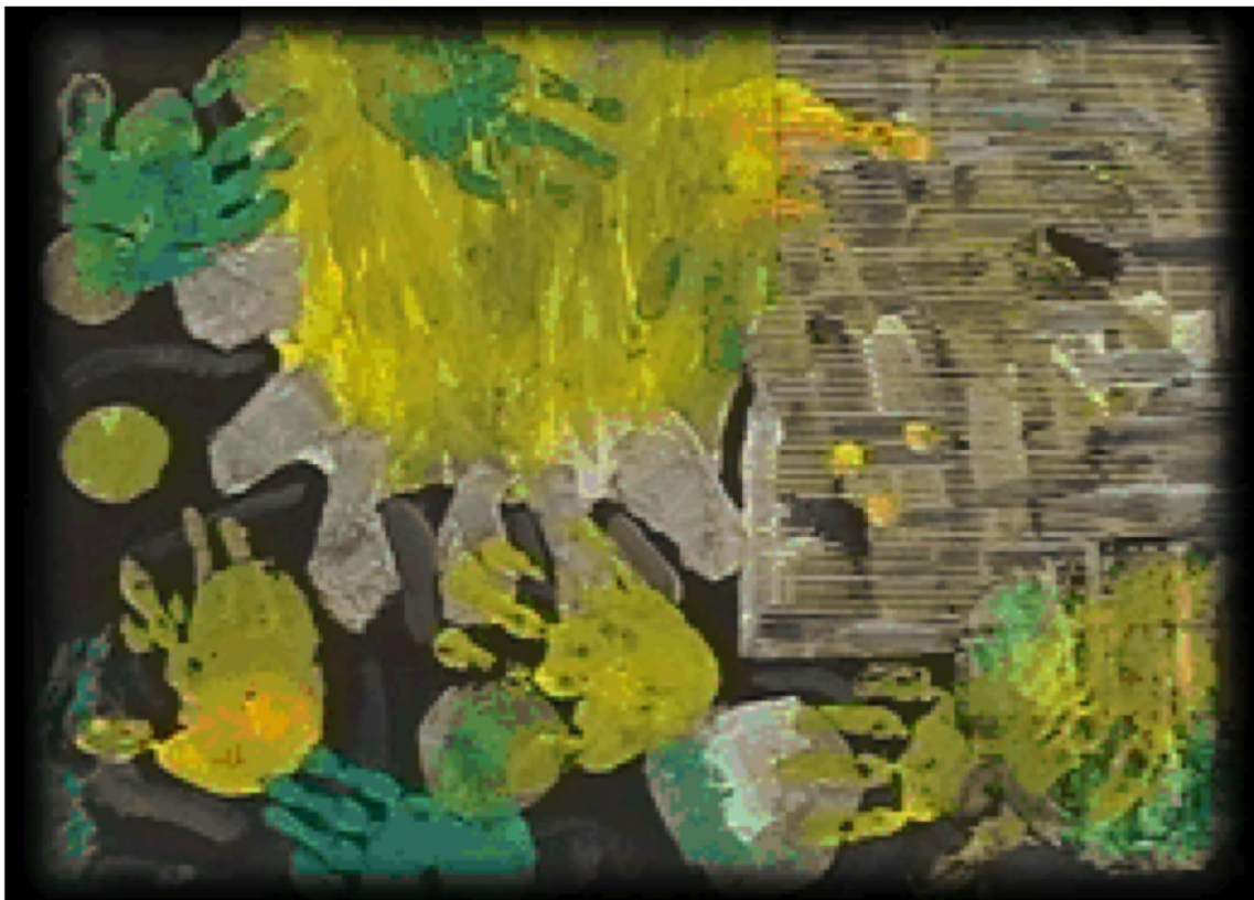
Dibujo 9: Pinturas al agua y collage de papeles sobre cartón reciclado DIN-A2

Hay que resaltar la importancia del tamaño de la superficie de trabajo, un tamaño en torno al DIN-A2 constituye el apropiado, y del tipo de superficie base del trabajo, cartón de reciclar o cualquier otro tipo de base rígida. Lo anterior y la impresión de las manos se realiza de forma espontánea en cualquier dirección acentúan el carácter de “acción” del trabajo.