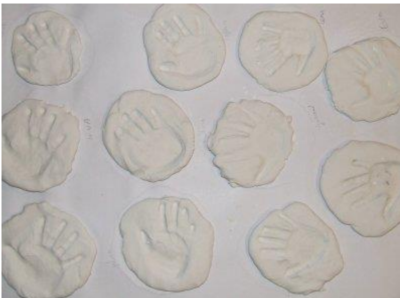
Figura 3: Impresión de manos sobre plastilina