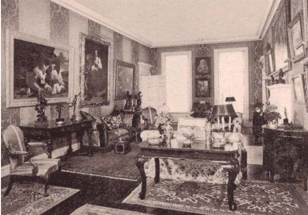
Figura17. Segunda reforma del Palacio de Villahermosa en 1805.

Uno de los salones con Santa Catalina de Caravaggio, Lot y sus hijas de Gentileschi y el Concierto de Preti.