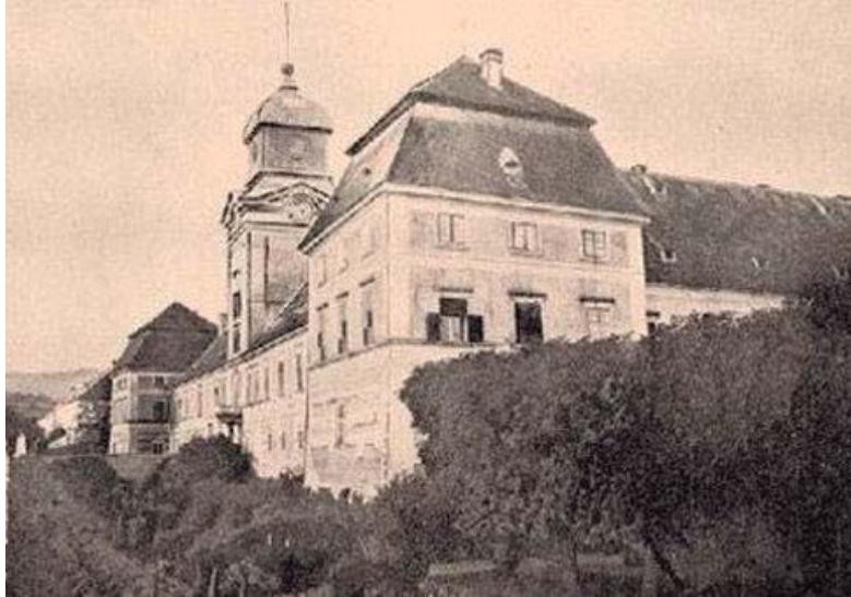
Figura 11. Catálogo de la exposición de la Colección Rohoncz celebrada en Múnich en 1930.

Derruido en 1945 debido a que se quedó en ruinas tras los bombardeos de la II Guerra Mundial.