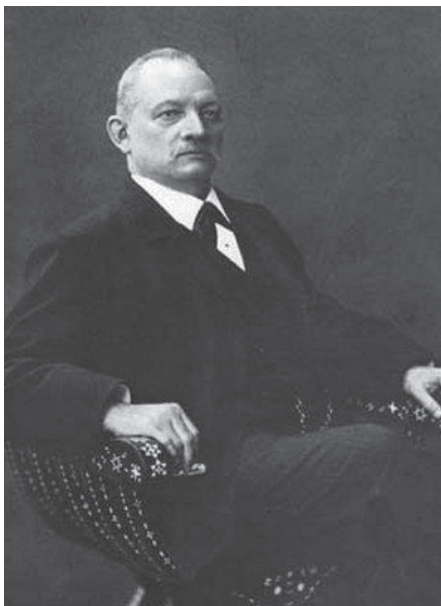
Figura 6. Fritz Thyssen (1873-1951).