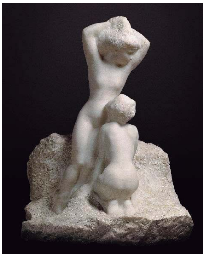
Figura 9. Heinrich Thissen-Bornemisza de Kászon et Impérfalva (1875-1947).