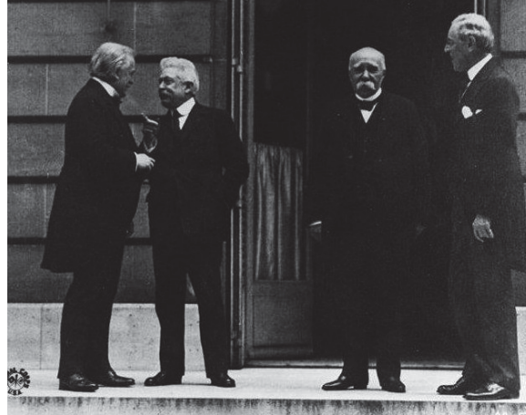
Figura 3. Tratado de Versalles (28 de junio de 1919).

Figura 2. En Versalles, los presidentes de las potencias vencedoras en la I Guerra Mundial. De izquierda a derecha, Lloyd George, primer ministro de Gran Bretaña; Vittorio Orlando, presidente de Italia; Georges Clemenceau, presidente de Francia; y Woodrow Wilson, presidente de Estados Unidos.