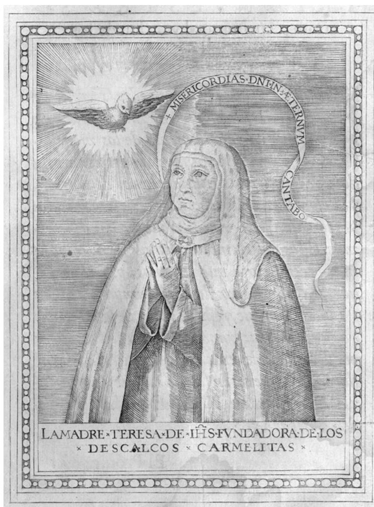
Figura 1. Retrato de Santa Teresa de Jesús en Anónimo, Los libros de la Madre Teresa de Jesús , Salamanca, Guillermo Foquel, 1588.

- Vida, virtudes y milagros de la Bienaventurada Virgen Teresa de Jesus , Lisboa, Pedro Crasbeeck, 1614.