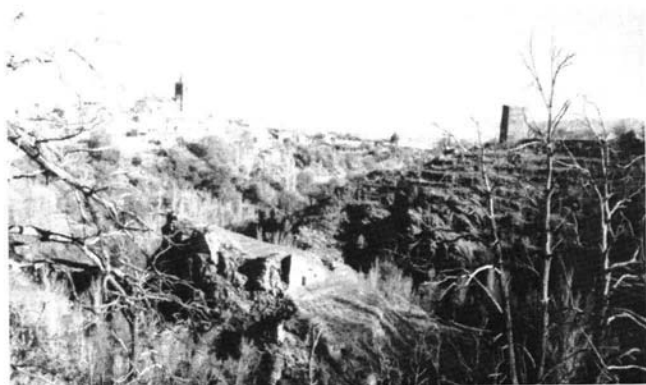
Foto 1: Situación de la torre de Alcázar (a la derecha) respecto al pueblo de Jérez y su castillo