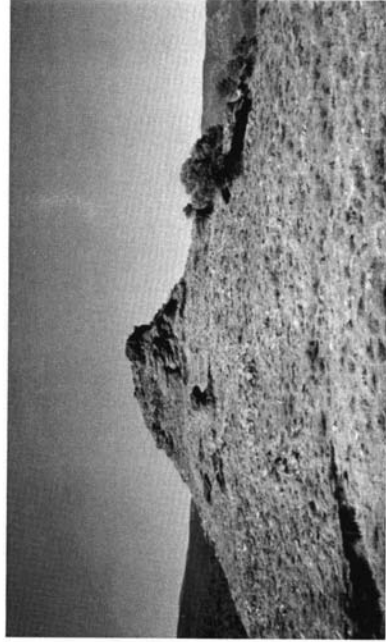
Foto 4: Castillo de La Reina. En la zona llana se sitúa el poblamiento y en espelón rocoso, al fondo, la fortificación