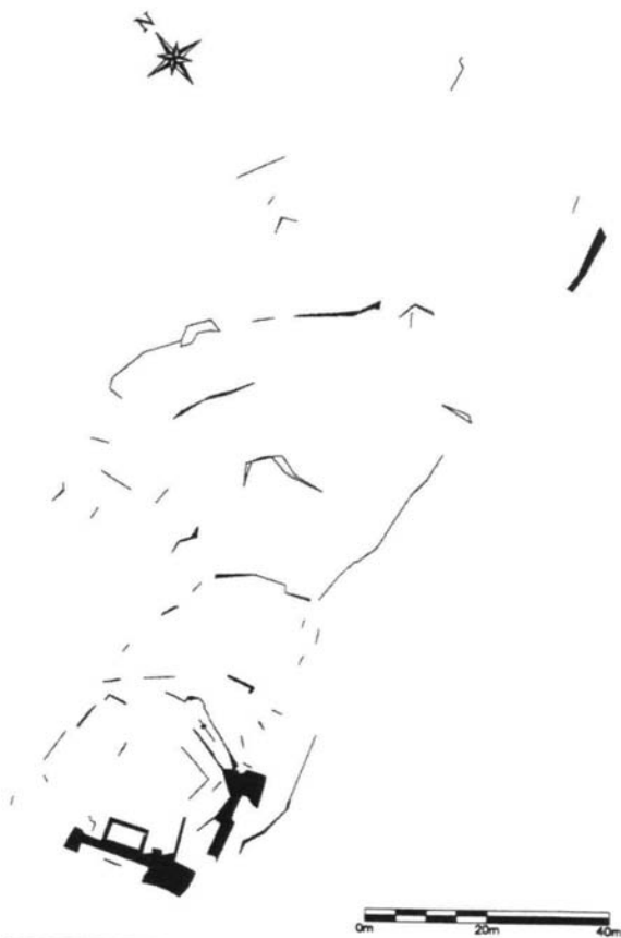
Fig 4.- Plano del Castillo de la Reina (Lanteira)

Levantamiento realizado por Mariano Martín Civantos y José María Martín Civantos