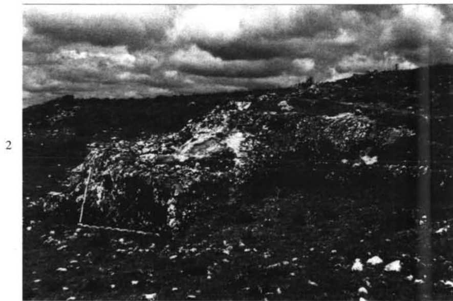
1. Ampliación de fotograma C-10 (hoja 347) del Vuelo Interministerial a escala 1:18.000 donde se pueden apreciar los restos de cimentación de la muralla.-2. Detalle de la cimentación del torreón tallado en la roca.